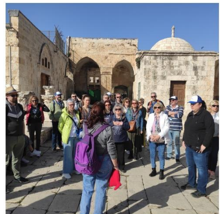
S putovanja naše općine u Izrael, veljača 2023.