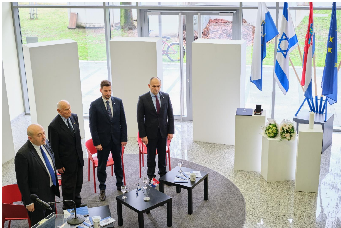
S ceremonije dodjele titule „Pravednik među narodima“ Kamilu Firingeru, 24. siječnja 2023.