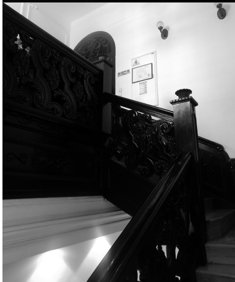
Слике 7. и 8. Степениште у вили Бенциона Булија