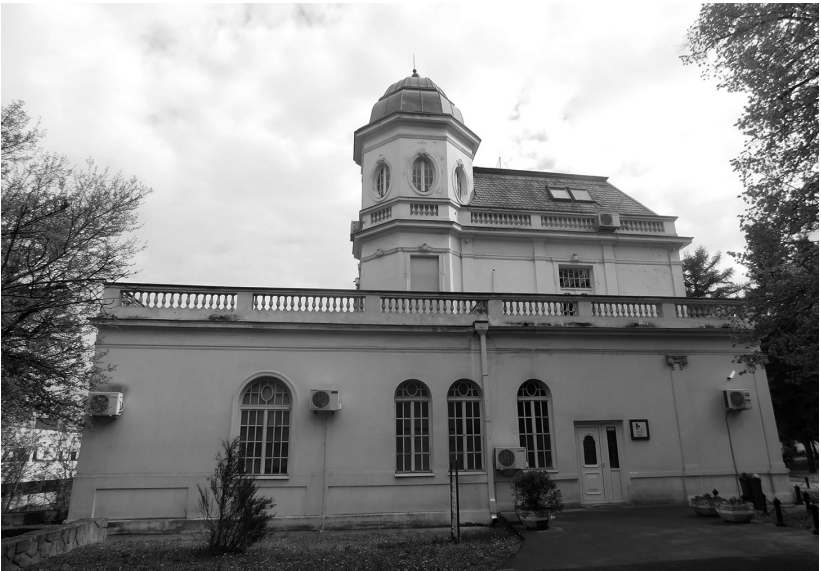
Слике 5. и 6. Вила Бенциона Булија, Михаило Белић (1928)

Главна вила представљала је најрепрезентативнију грађевину у овој амбијенталној целини. Сама просторна концепција главне vile била је конципирана на следећи начин: имала је подрум, приземље, први спрат и мансарду која је имала функцију тавана.