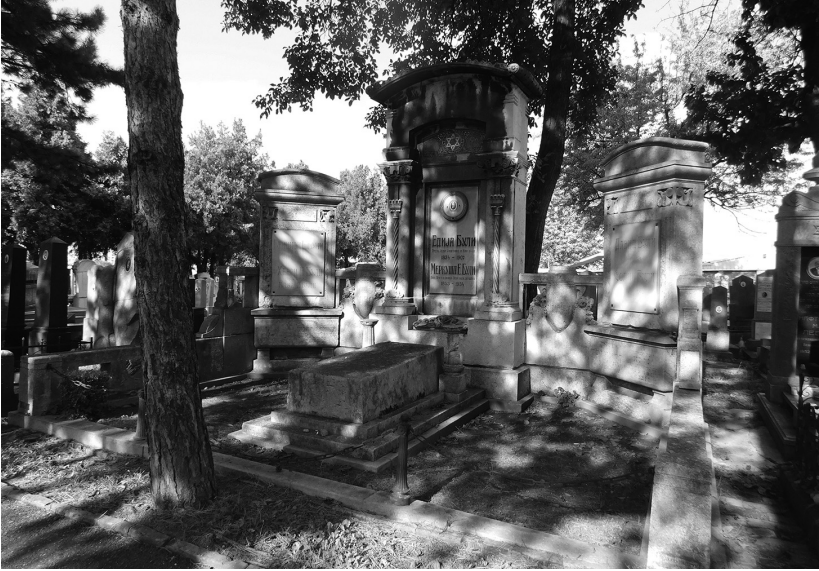
Слика 12. Гробница породице Були, Вулкан и Нојбрун Беч (почетак 20. века)

Два масивна стуба која фланкирају централни споменик по типу су блиски изгледу коринтског стуба, али по својој декорацији они су еклектични и наглашени су вертикалним тордираним стубовима са капителима. Испод атике између стубова налази се мозаичка декорација, у чијем централном делу је приказан Маген Давид у комбинацији златне, љубичасте, беле и плаве боје. Хексаграм који је овде приказан је бочно фланкиран са два квадрата [74, стр. 43]. Цео концепт приказивања Маген Давида се надовезује на централно-европску праксу. То је симбол који се за јеврејство везује последњих неколико векова, први пут се као симбол Јевреја јавља у 16. веку на једном надгробном споменику у Прагу [27].