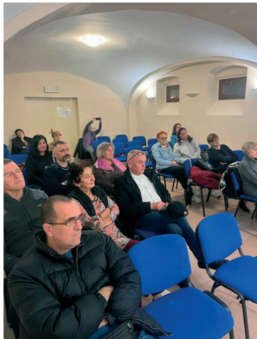
Promocija u knjižari Nova

đivanja prije nego što se shvati, te da ne postavlja pitanje prije nego što je posve siguran da zaista to što pita jest pitanje o biti stvari, ali i da ne smetne s uma kako će trebati prosuđivati o onome što knjiga sadrži. Uostalom još je Henri Lefbvre, taj poznati francuski intelektualac, filozof i sociolog, u svojoj Kritici svakidašnjeg života podsjetio da i čak prije ili poslije epskog momenta odluke i čina, treba suditi neprestano i uvijek. To je jedini čvrsti stav, jedini trajni zahtjev usred promjena, to je osovina života. Takav pristup čitanju ovog djela, tj. cijelo ovo djelo Nadie–Michal Brandl, izvlači tu bolnu tematiku Židova iz užihih okvira zbivanja i s obzirom na širinu u promatranom razdoblju uopće stavlja ju, bezuvjetno, u mnogo širi kontekst.