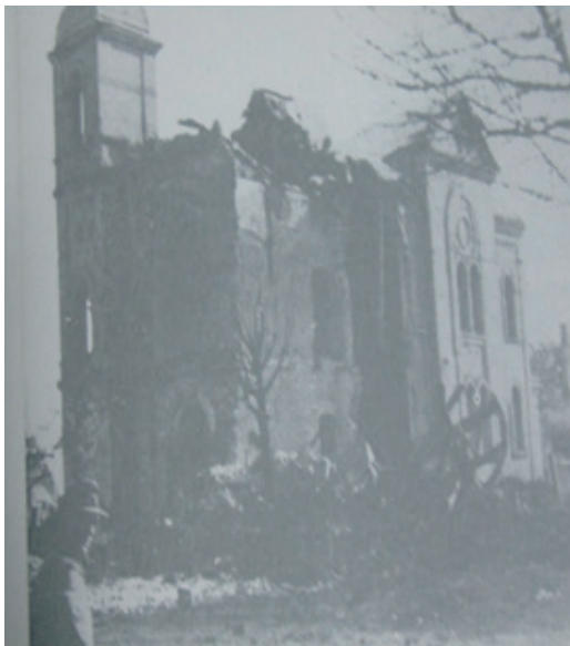
Remains of the synagogue after destruction