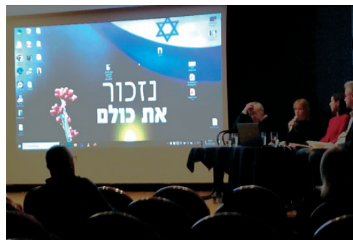
Predavanje u Zagrebu

skoj kulturi, znanosti i društvenim događajima kako u Hrvatskoj tako i u svijetu. U radu društva sudjeluju članovi židovske zajednice iz Hrvatske, ali i mnogi drugi istaknuti društveni radnici, političari i znanstvenici koji afirmativno prikazuju povijest i suvremene događaje vezane za Židove i državu Izrael.