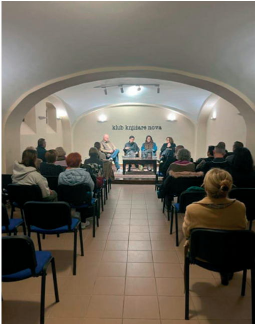
Presentation at the Knjižara Nova