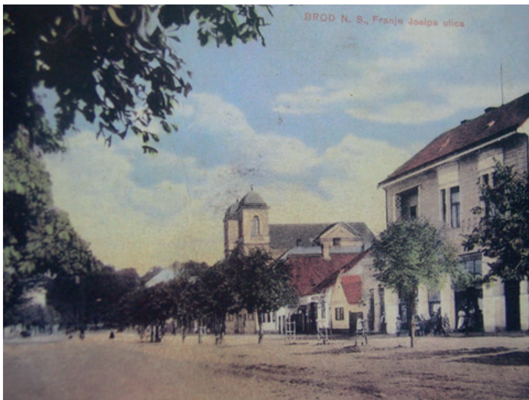
Slavonski Brod with the synagogue in 1920s