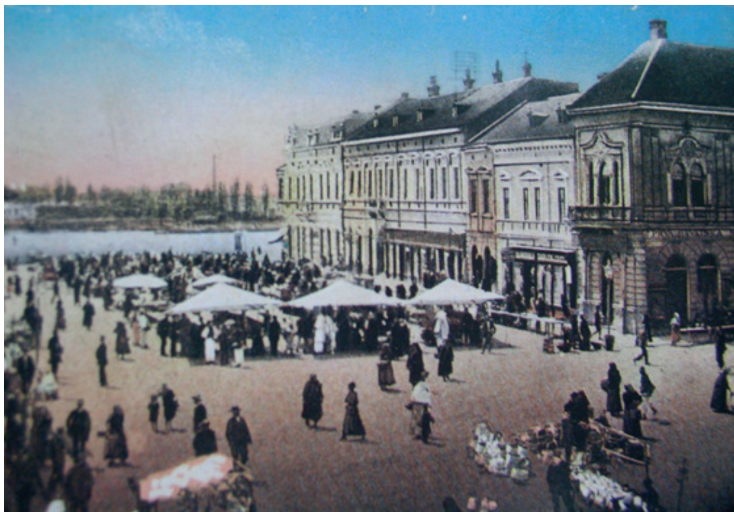
Pogled na Jelačićev trg i Bauеровu kuću (druga od uglovnice)

vile trgovinom povećavao. Nakon što je 1873. Hrvatski sabor zakonski proglasio ravnopravnosti Židova u Kraljevini Hrvatskoj, Slavoniji i Dalmaciji 28. rujna te godine 16 brodskih odrašlih Židova zatražilo je odobrenje za