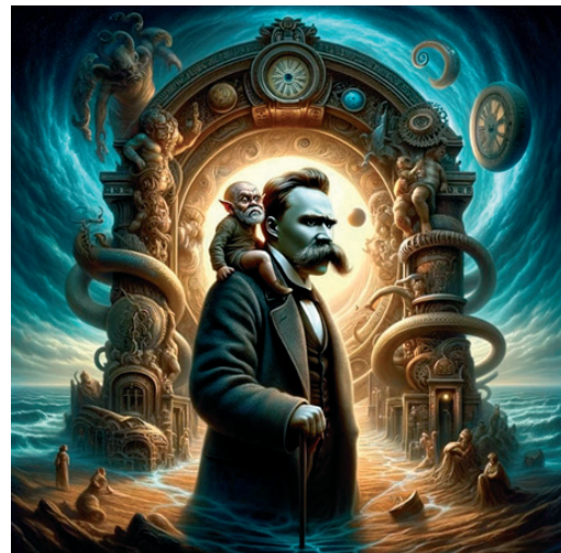
Illustration of the novel “Thus Spoke Zarathustra” by a software Source: Boris Bosančić

In Hinduism, it is believed that “everything has already been”, that is, time is the circle through which events flow. Time is organized into yugas, i.e. phases with characteristic properties. There are four yugas which alternate constantly like the four seasons. Each cycle lasts over four million years, and the shortest is the kali yuga, lasting about 432,000 years. According to the Hindu calendar, the world is now in the kali-yuga, which began in 3102 BC. n. e., which is characterized by conflicts and wars. The Hindu cycle is characterized by constant degra-