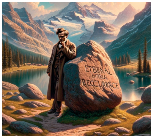
Ilustracija softvera na temu vječnog vraćanja

U hinduizmu, smatra se da je “sve već bilo”, odnosno, vrijeme je krug kojim teku događaji. Vrijeme je organizirano u yuge, odnosno faze s karakterističnim svojstvima. Postoje četiri yuge koje se stalno izmjenjuju kao četiri godišnja doba. Svaki ciklus traje preko četiri milijuna godina, a najkraća je kali yuga, u trajanju od oko 432 000 godina. Prema hinduističkom kalendaru, sada se svijet nalazi u kali-yugi, koja je započela 3102 g. pr. n. e., a koju karakteriziraju sukobi i ratovi. Hinduistički ciklus karakterizira stalna degradacija: prva yuga je