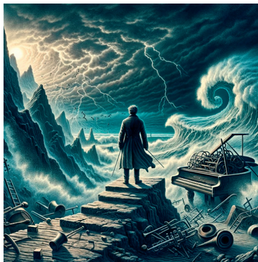
Softverska ilustracija Nietzscheovog koncepta krize judeokršćanskog morala

Drugom zapovijedi Dekaloga zabranjeno je bavljenje slikarstvom i kiparstvom, no kršćanstvo je kroz povijest reinterpretiralo tu zapovijed, čemu možemo zahvaliti širenje vizualnih umjetnosti u doba humanizma i renesanse. Međutim, ostaje činjenica da tekst Druge zapovijedi glasi: “Nećeš stvarati za sebe kip ili sliku ičega