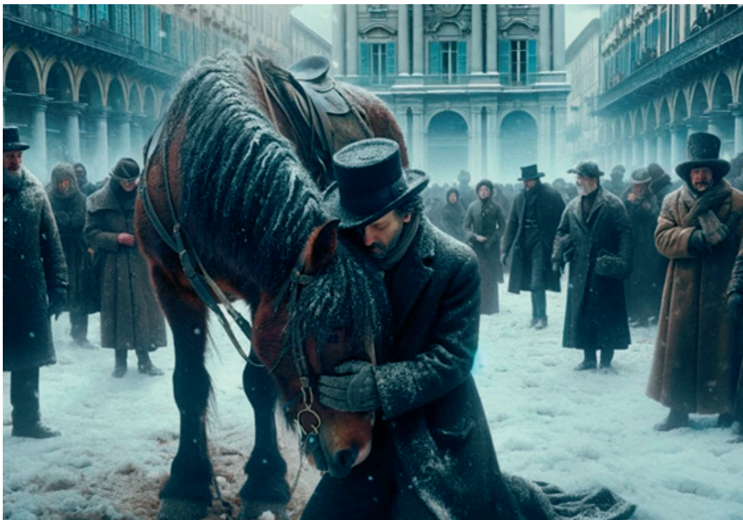
Disinformation or illustration? Friedrich Nietzsche petting a horse, made by the software

on disinformation at the Salon of the Academy of Arts and Culture in Osijek (March 1, 2024). It should not be surprising that the main carriers of fake news are precisely - photos and videos. This text will explain how visual media play with the perception of individuals and create false realities - from antiquity to today.