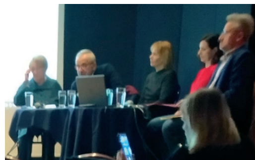
Lecture in Zagreb

ture, science and social events both in Croatia and in the world. Members of the Jewish community from Croatia participate in the society's work, as well as many other prominent social workers, politicians and scientists who affirmatively present history and contemporary events related to Jews and the state of Israel.