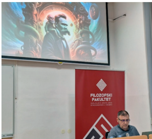
Predavanje prof. Borisa Bosančića

što se u kabali naziva kontaktom između muškog i ženskog svijeta). Čovjek je dužan izgrađivati materijalni svijet, aktivno djelovati, donositi velike odluke i u njima ustrajati. U hinduizmu, čovjek zapravo nema utjecaj na materijalni svijet, koji se izmjenjuje prema unaprijed određenim yugama.