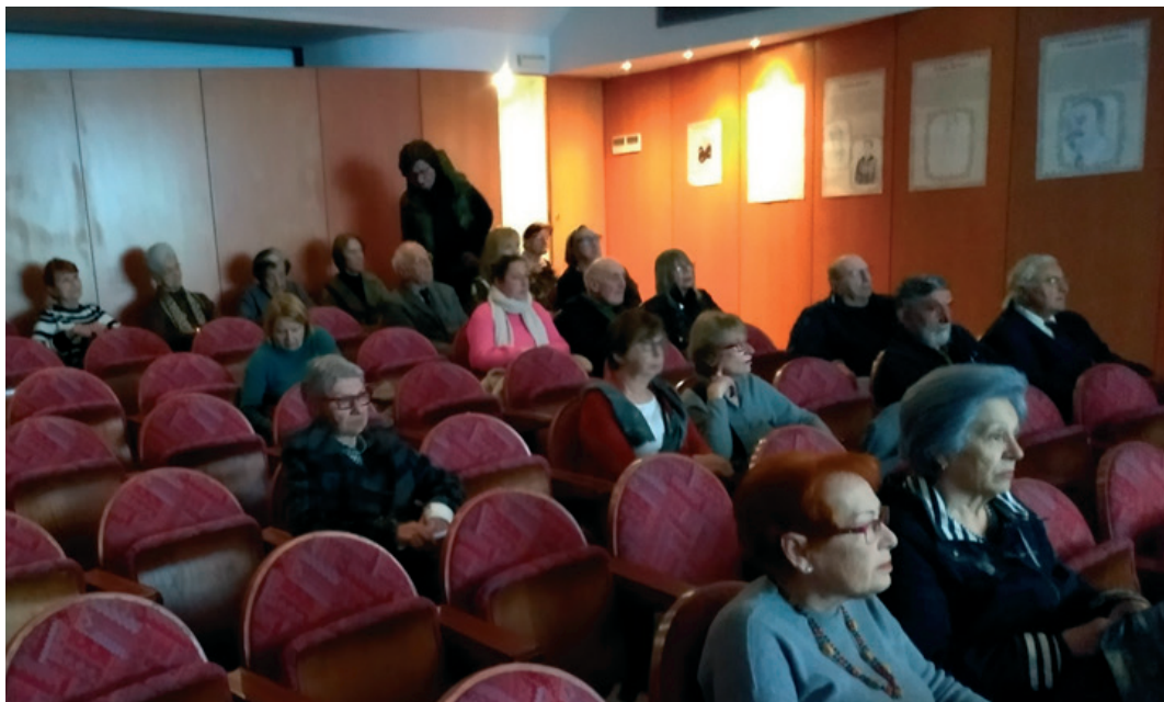
Predavanje u Zagrebu