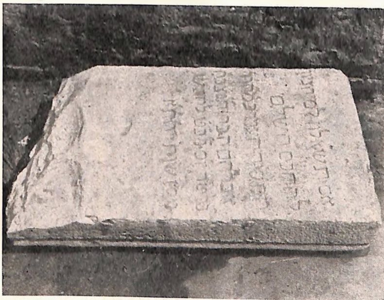
Ovaj nadgrobni kamen se sada nalazi u dvorištu sinagoge u Beogradu, Kosmajaska 19.

U do sada poznatim literarnim izvorima o beogradskim Jevrejima nigde se ne pominje ime ovog rabina. U svojoj knjizi „Jevreji u Beogradu“, rabin Ignjat Šlang pominje kao beogradske rabine prve polovine XVII v. samo Meira Andela (do 1617. g.) i Judu Lerma (od 1617. do oko 1642. g.). 1 Prema tome, rabin Avraham Kohen je verovatno samo privremeno bio nastanjen u Beogradu, možda samo kao gost ili rođak neke rabinske ili druge jevrejske porodice. Ostaje da se putem ispitivanja starih literarnih izvora i dokumenata o Jevrejima susednih zemalja sazna nešto više o njemu.