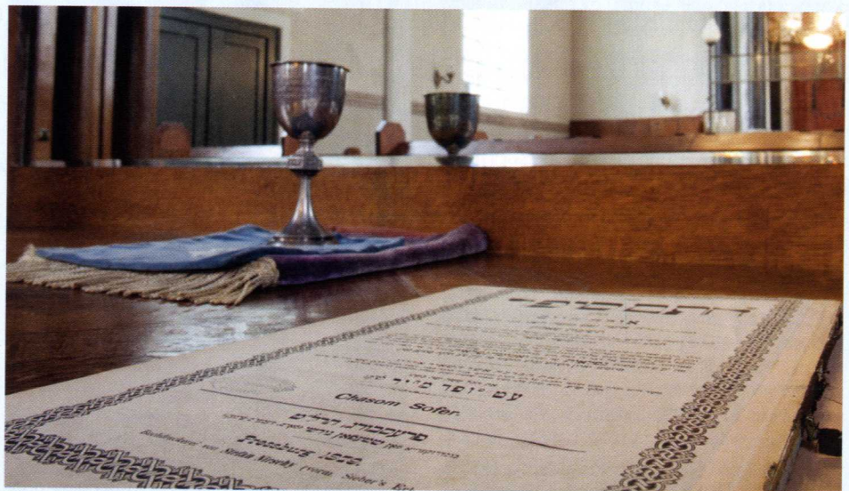
Za vrijeme obreda vjernici su okrenuti prema mjestu u kojem se čuva sveta knjiga (Thora). U tijeku godine najsvečanije je na blagdan Jom Kipur

Mala skupina riječkih Židova svojim se radom istinski trudi "ne zaboraviti", a bogatstvo koje njihova kultura donosi riječkom mozaiku multikulturalnosti svakom bi Riječaninu trebalo biti podsjetnik na važnost očuvanja slojevitog identiteta kojim se, kao malo koji grad, može ponositi grad na Rječini. ■■