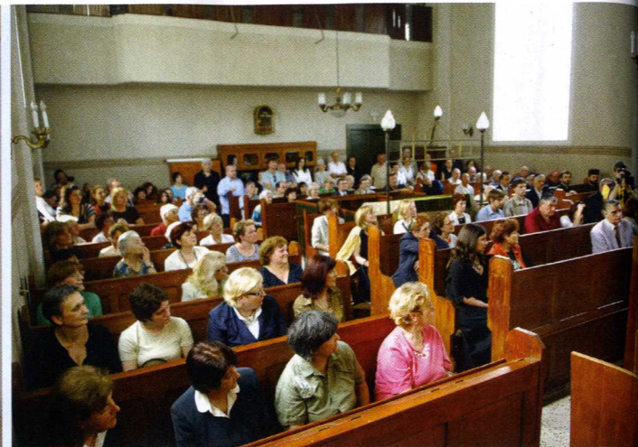
Sa otvorenja obnovljene sinagoge 2008. godine