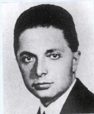
Riječki kvestor Giovanni Palatucci spasio je živote brojnih riječkih Židova