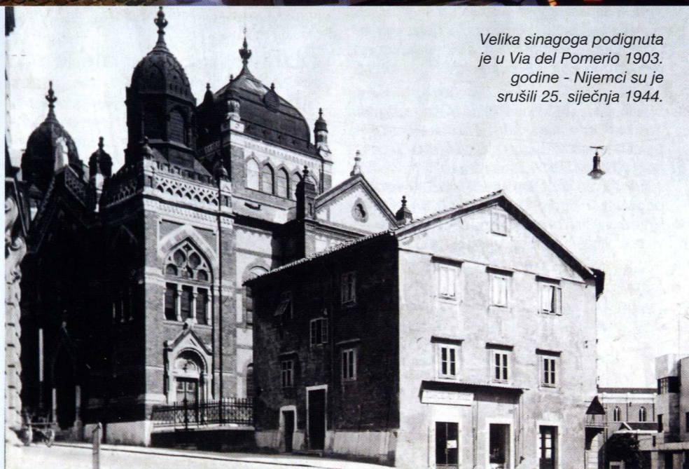
Velika sinagoga podignuta je u Via del Pomerio 1903. godine - Nijemci su je srušili 25. siječnja 1944.

U prvo vrijeme svog naseljavanja Rijeku Židovi su za vrijeme povremenih boravaka stanovali u prostoru grada zvanom Zuecha ili Zudecca, što bi odgovaralo poznatom venecijskom izrazu Giudecca. Zudecca se nalazila u Starom gradu, jugoistočno od katedrale Sv. Vida, otprilike na mjestu gdje je danas zdanje OŠ Nikola Tesla. Njezin se nastanak može objasniti i praktičnim razlozima. Naime, lokalne su riječke vlasti, zbog trgovačkog probitka dolazile u doticaj s trgovcima židovske vjeroispovijesti i nastojeći im osigurati odvojen smještaj, gradeći i iznajmljujući posebne zgrade gdje mogu prebivati. Tako su u Rijeku