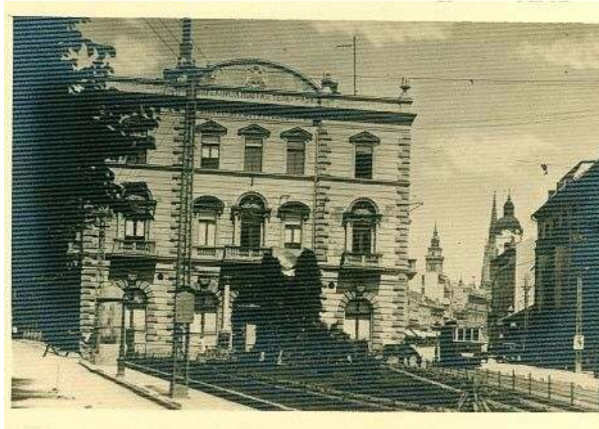
Železnička ulica iz koje su odvedeni zaboravljeni srpski velikani doktor Ignjat i Olga Pavlas

Konačno, posle višedecenijskih neistina, 12. septembra 2007. na stupcima jednog dnevnog lista osvanula je stvarna slika strašnih zbivanja iz 1942: činjenica da su razmere pokolja šire od takozvane Novosadske racije, da se novosadske žrtve broje u hiljadama i da je reč o genocidu!