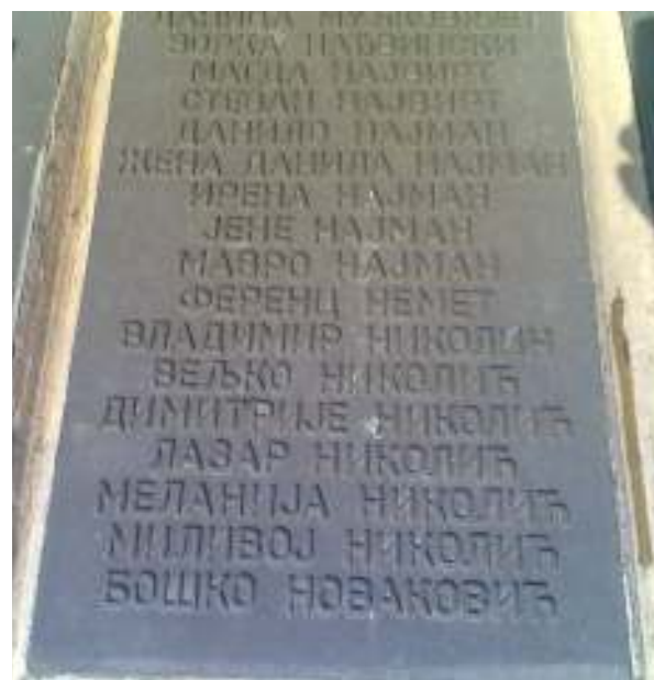
1984. nisu hteli neme spomen-ploče