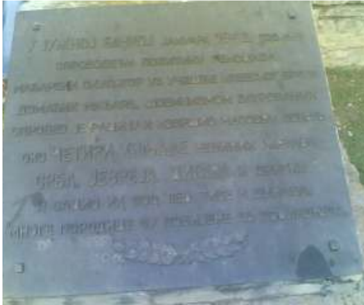
Spomenik nekada ustaljenih, nepotpunih podataka