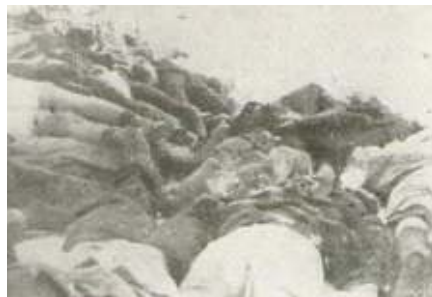
Žrtve na Uspenskom groblju

Dovoljno podataka nema ni za ostale žrtve u južnoj Bačkoj. Nedugo nakon zločina pojavile su se procene broja ubijenih. Svetozar Marković Toza piše partizanima u Sremu 20. maja 1942. da je „samo u Novom Sadu“ životom platilo „ preko 2.000 ljudi “. 38 Iste godine, 10. oktobra Branko Bajić i Toza Marković predočavaju „drugu Titu“ da je „poubijano oko 10.000 duša u Šajkaškoj i Novom Sadu“. 39