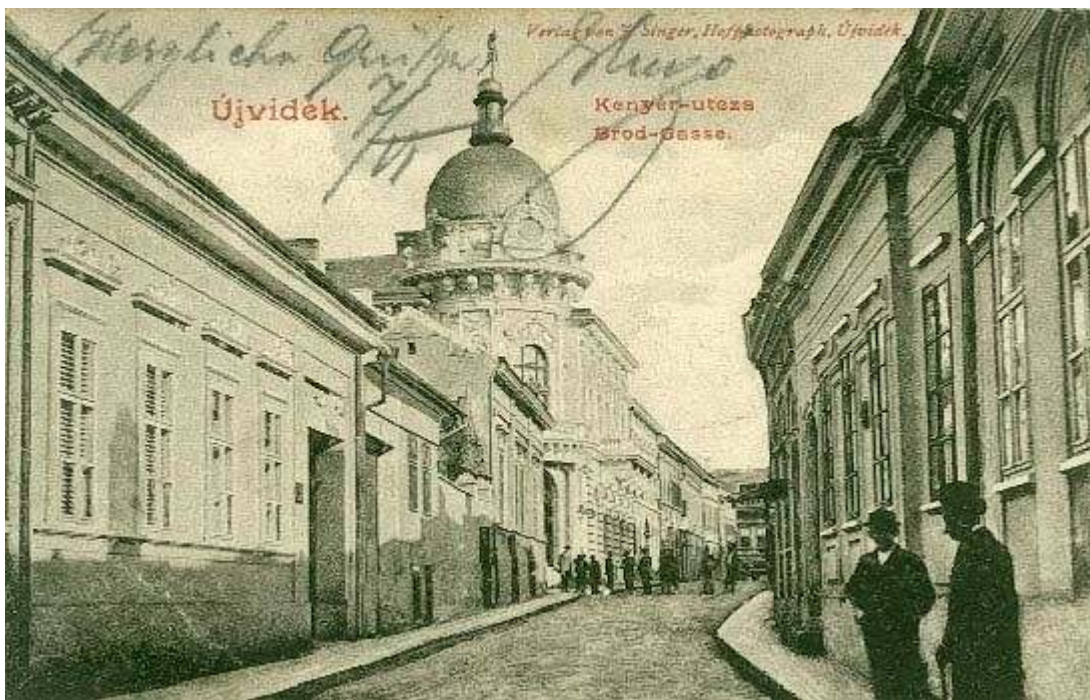
Elitna Miletićeva ulica: 23. januara 1942. potpuno istrebljena

U Novom Sadu je, na primer, masovno ubijanje teklo puna tri dana u zvaničnom prisustvu komandanta segedinske armije, dakle sa njegovom potpunom odgovornošću. U vezi sa ubijanjem, razbojništvom i krađama koje su se desile u samom centru grada gde stanuje imućniji svet, zaključujem da izgovor da se stanovništvo „pročešlja“ od komunista ovde nije dobar. Zar komuniste treba tražiti kod imućnijih jevrejskih trgovaca ili kod članova obrazovane srpske inteligencije? Pa zar se i zbog samog komunizma mogu bez suđenja ljudi, žene, deca i odojčad nekažnjeno ubijati?