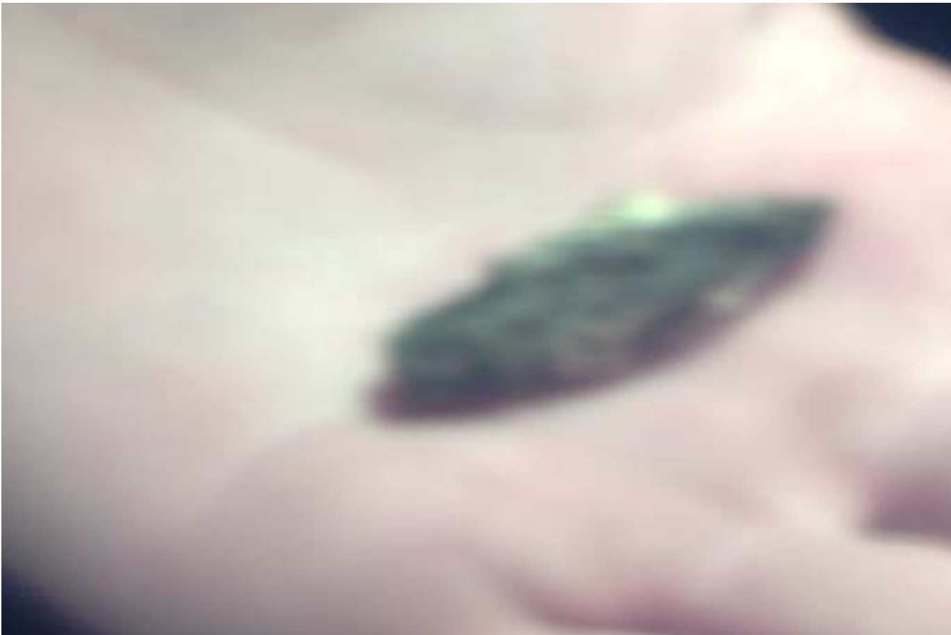
Prvi metak pronađen u čuruškom magacinu tokom Noći muzeja 2010, 69 godina posle pokolja