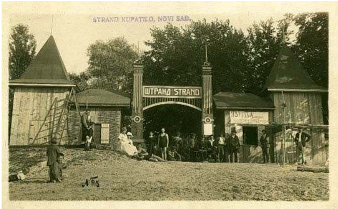
Štrand: neobeleženo novosadsko stratište

Taj citat je objavljen u našoj zemlji još 1976. 26