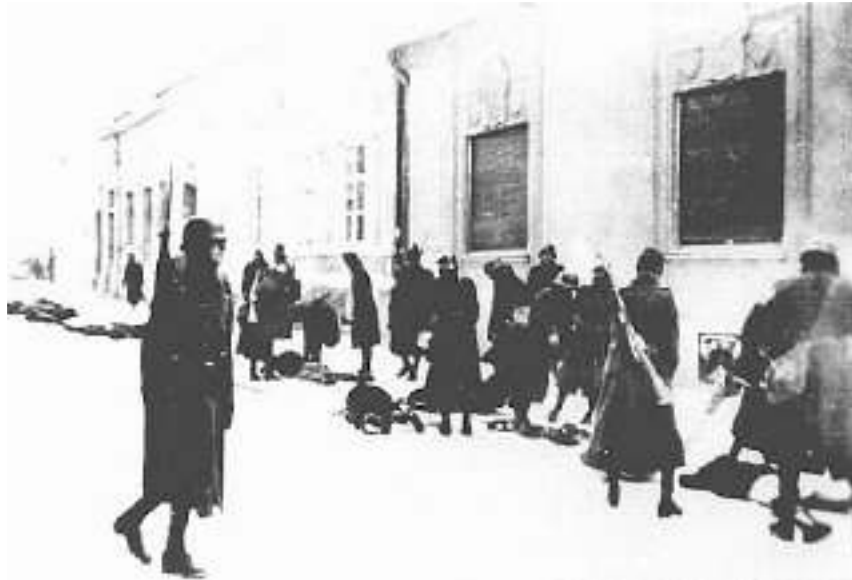
Istrebljivanje Novosađana u Miletićevoj ulici 23. januara 1942.

Šef nemačke policijske bezbednosti, SS pukovnik Minberg, 25. februara 1942. izveštava Ministarstvo spoljnih poslova u Berlinu o stanju u Bačkoj. Na osnovu izjava zvaničnika mađarske vlade, Minberg beleži da je u Novom Sadu ubijeno 1.800 Srba sa ženama i decom! 7 Ako su iskorenjene srpske porodice u proseku imale tri člana, dolazimo do izjave u filmu „Spomenik“ kada majka kaže glavnom junaku da je njegov otac bačen pod led u Dunav sa preko 5.000 ljudi, žena i dece iz Novog Sada. Kada dodamo i 1.256 identifikovanih jevrejskih žrtava i žrtve drugog etničkog porekla o kojima nema ni reči u Minbergovom izveštaju, ostajemo zaprepašćeni nad razmerama novosadskog genocida.