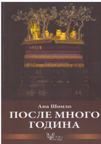
Novo iz banjalučke Kuće poezije