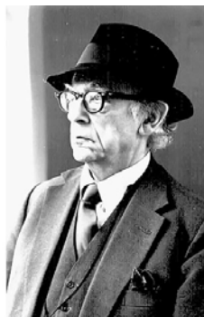
Isaija Berlin je mislioce delio na ježeve i lisice