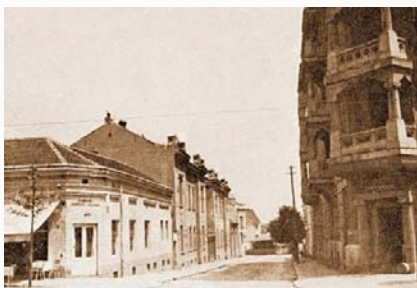
Dorćol, Jevrejska ulica