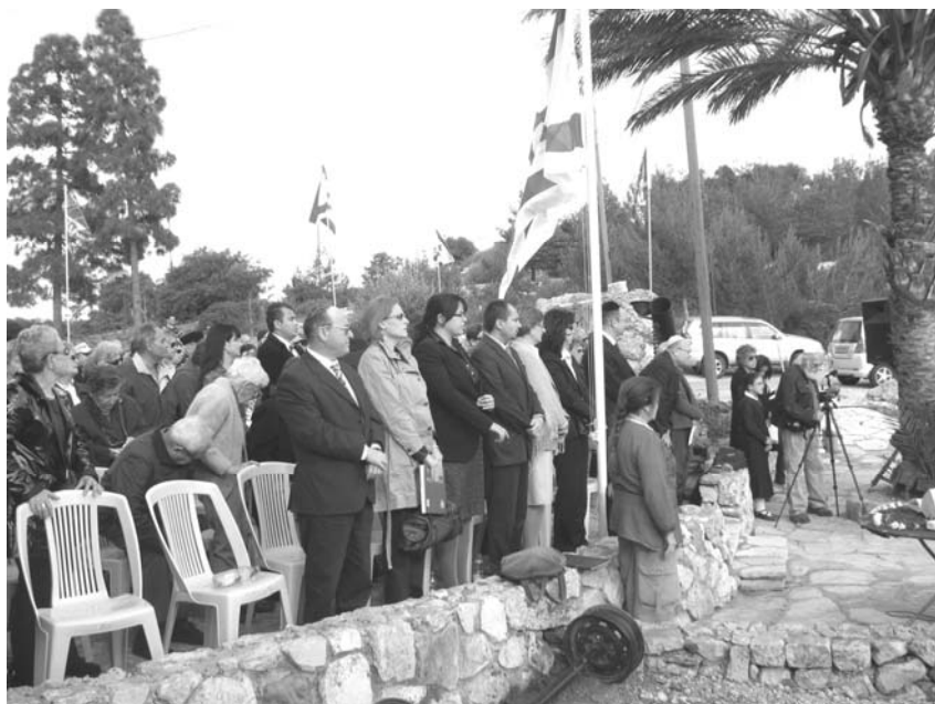
Diplomatski kor ex Yu odaje poštu stradalima u Šoa