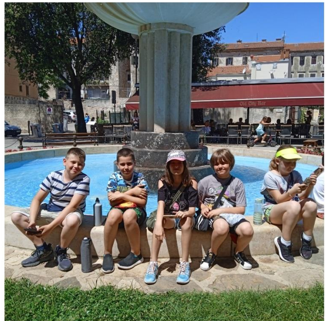
Ljetni dječji kamp Pula 2022.