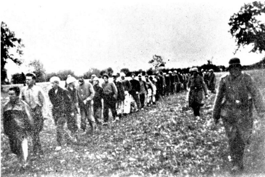
Zasavica – Kolona smrti

Žene iz logora u Šapcu su sa decom po izuzetnoj hladnoj zimi, februara 1942.g. oterane iz Šapca za Beograd. Išle su pešice po snegu i vetru noseći u rukama i vodeći za sobom decu koja su se usput smrzavala i umirala od jake hladnoće. Majke su, po svedočenju očevidaca, ludele od bola za decom i čupale kosu. One koje su stigle do logora Sajmište, bile su likvidirane u kamionu sa gasom.