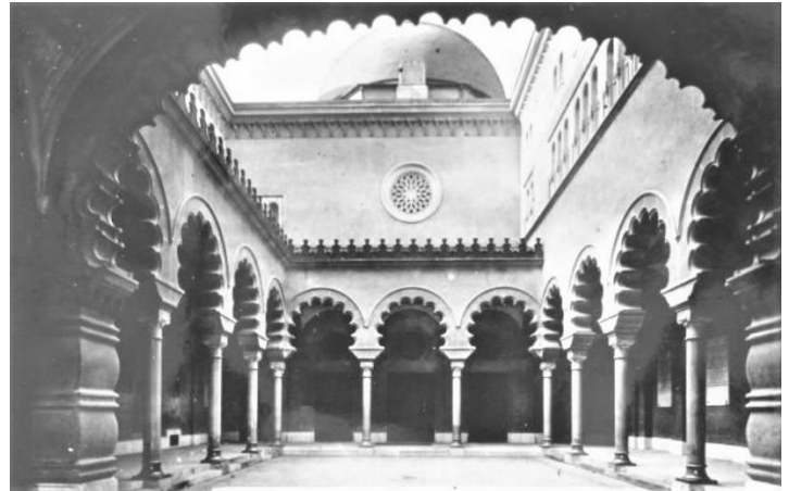
Ovako je izgledao originalni ulaz

Zgrada sarajevskog Bosanskog kulturnog centra, poznatija kao "Templ", odnosno Veliki novi Hram kako se zvala kada je sagrađena (30-ih godina 20 vijeka) je spomenik kulture nulte kategorije i bilo kakve izmjene u njenom izgledu su zabranjene bez suglasnosti nadležnog Zavoda za zaštitu spomenika.