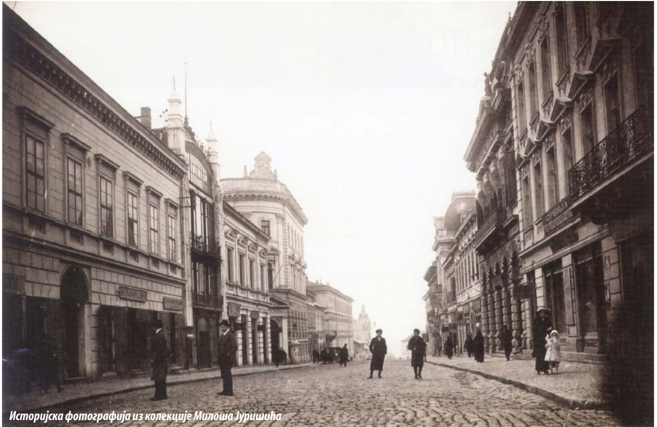
Историјска фотографија из колекције Милоша Јуришића

In the former main commercial street of Belgrade, Kralja Petra Street, a bit hidden at first sight, there is a real architectural jewel, proportionate and graceful, rarity for our city. This unusual author's achievement, known as the Department store, was built in 1907 after the design by engineer Viktor Azriel.