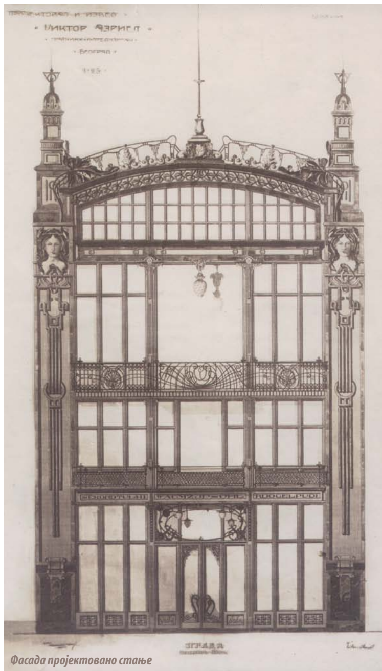
Фасада пројектовано стање