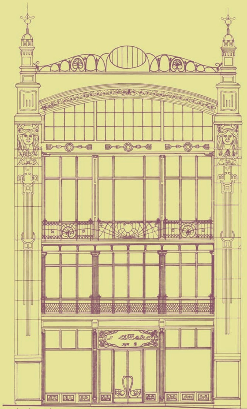
Фасада изведено стање