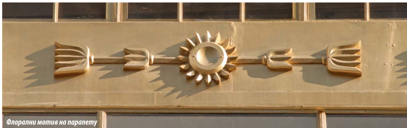
Флорални мотив на парпету

продајни простор. Робни магацин је био прва трговачка зграда у Београду у којој је више етажа међусобно спојено и отворено, јер је прегледност један од основних услова који је неопходно испунити у пројектовању магацина. Овако отворен простор постигнут је употребом стубова и галерија, као и гвозденим мостом који је повучен кроз централни део у висини првог спрата, а осветљен је преко фасаде и правоугаоних лантерни на равном крову. Највиши спрат је сасвим издвојен гвозденим таваницом и предвиђен за складиште, а у задњем делу, иза продајног простора, смештене су канцеларије.